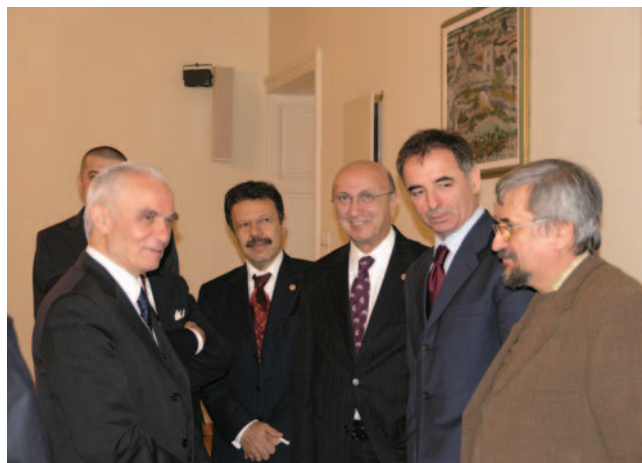
Milorad Pupovac primio izaslanstvo turske Nacionalne skupštine

(Zagreb, 15. prosinca 2008.) Milorad Pupovac i Yaşar Yakiş uvodno su konstatali kako su odnosi dviju zemalja vrlo dobri i bez otvorenih pitanja. Središnje teme razgovora bile su proširenje parlamentarne suradnje te pro-