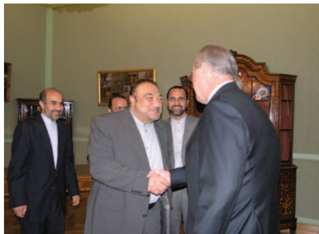
Neven Mimica primio zamjenika ministra za Europu iranskog Ministarstva vanjskih poslova