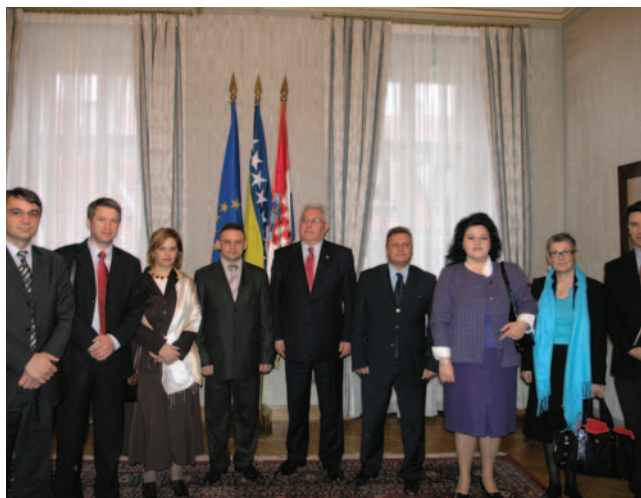
Predsjednik Sabora Luka Bebić s izaslanstvom Zastupničkog doma Parlamentarne skupštine BiH

(Zagreb, 2. prosinca 2008.) Predsjednik Hrvatskoga sabora Luka Bebić primio je izaslanstvo Hrvatskog nacionalnog vijeća Crne Gore koje su činili njegov predsjednik Miroslav Marić i tajnica Vijeća Selma Krstović. Na sastanku se razgovaralo o unapređenju suradnje hrvatske manjine u Crnoj Gori s matičnom državom Hrvatskom i o rješavanju prostornih problema Hrvatskog nacionalnog vijeća u Tivtu.