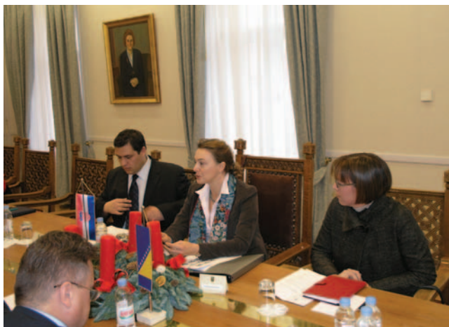
Članovi Odbora za europske integracije s izaslanstvom Parlamentarne skupštine BiH

„Izuzetno bitno je njegovanje odličnih odnosa s Hrvatskom i Srbijom, s obzirom na činjenicu konstitutivnosti triju naroda Bosne i Hercegovine, bošnjačkoga, hrvatskoga i srpskog”, rekao je Matić. Bosnu i Hercegovinu 2009. godine očekuje rekonstrukcija Daytonskog mirovnog sporazuma i pronalaženje novog ustavnog rješenja. Ono treba biti na zadovoljstvo svih triju konstitutivnih naroda, te takvo koje će prihvatiti Bosnu i Hercegovinu kao funkcionalnu i održivu državnu