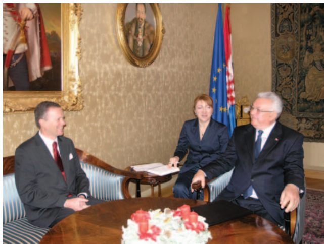
Predsjednik Hrvatskoga sabora Luka Bebić i švedski veleposlanik Fredrik Vahlquist

(Zagreb, 11. prosinca 2008.) Predsjednik Hrvatskoga sabora Luka Bebić primio je u nastupni posjet veleposlanika Kraljevine Švedske Fredrika Vahlquista. Predsjednik Sabora Bebić sa švedskim je veleposlanikom Vahlquistom, osim o bilateralnim odnosima koji su ocijenjeni kao izvrsni i prijateljski, te o dobroj bilateralnoj suradnji, razgovarao o procesima ratifikacije Lisabonskog ugovora i proširenja Europske unije. Švedska predsjedava Europskom unijom u drugoj polovici 2009. godine, a Hrvatska planira završiti pregovore s EU do kraja švedskog predsjedanja.