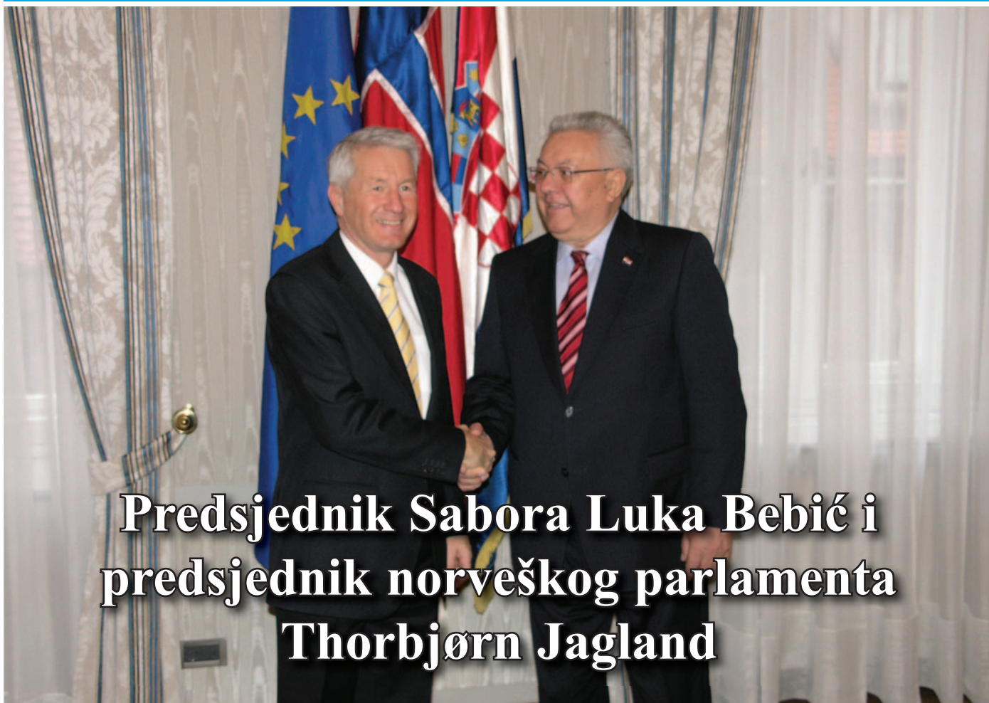
Predsjednik Sabora Luka Bebić i predsjednik norveškog parlamenta Thorbjørn Jagland