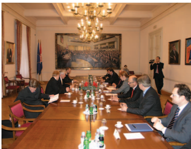
Predsjednik Sabora razgovarao s predsjednikom norveškog parlamenta

Predsjednik turskog Odbora za europsko usklađivanje Yaşar Yağış pozdravio je napredak Hrvatske u pregovorima s EU izrazivši nadu da će ih Hrvatska i zaključiti do kraja 2009. godine. Izrazio je zadovoljstvo suradnjom koju njegov odbor ima sa saborskim Odborom za europske integracije. Zadovoljstvo je izrazio i skorim ulaskom Hrvatske u NATO jer je i osobno podržao jednoglasno usvojenu rezoluciju turskog parlamenta iz 2004. godine s tim u vezi.